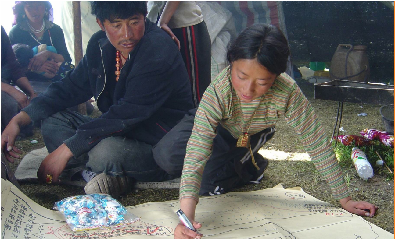
Recueillir les avis des femmes et des hommes - femme dans une famille de bergers au Tibet impliquée dans la cartographie de leur région.

pâturages les plus nutritifs et de mieux maîtriser les problèmes sanitaires (maladies du bétail). En parvenant à tirer parti d'un environnement imprévisible et soumis à des fluctuations récurrentes, les pasteurs détiennent une véritable expertise en matière de gestion du risque et de l'incertitude.