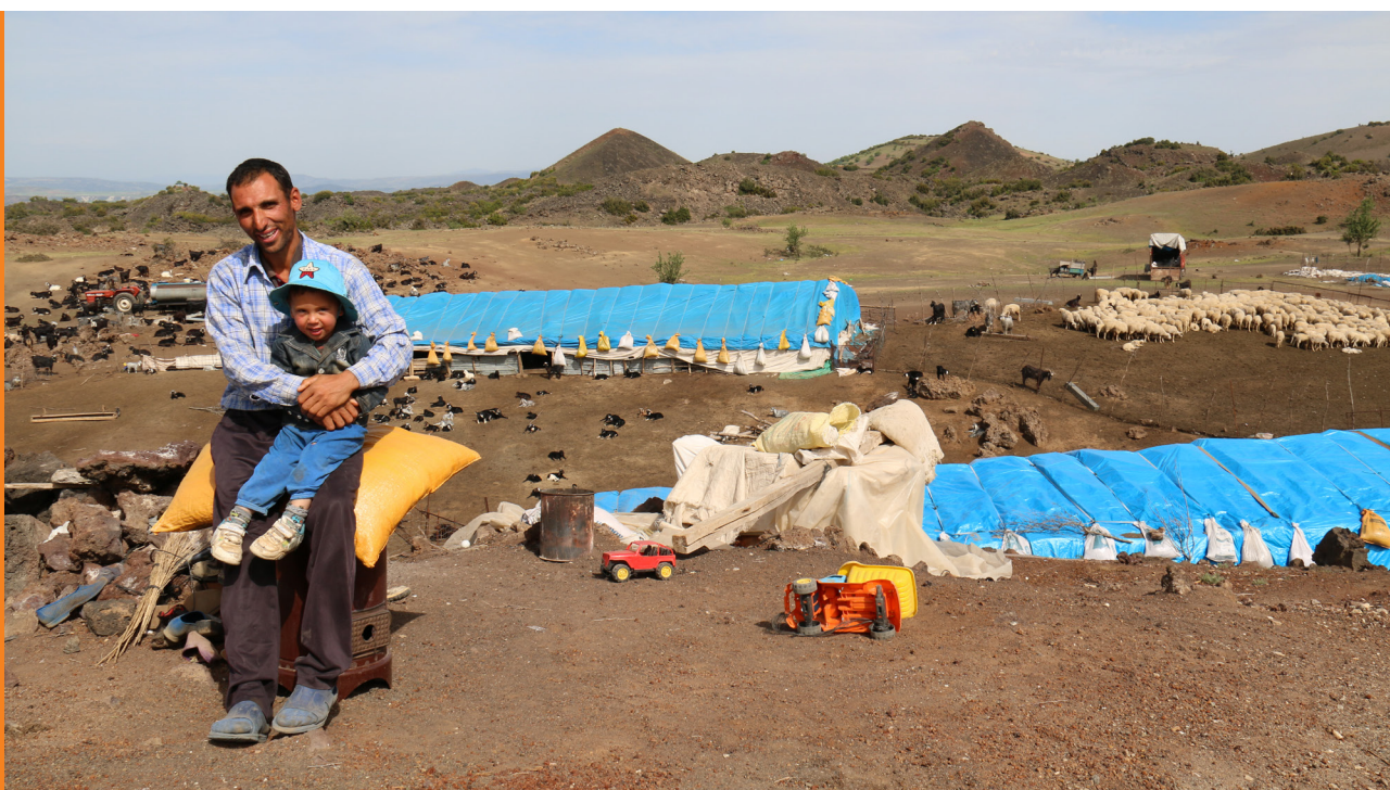
Un éleveur pasteur et son fils sur un pâturage hivernal en Turquie.

La production pastorale et sa durabilité sont directement conditionnées par l'écologie des parcours d'élevage, par exemple les prairies, les savanes, les forêts sèches, la toundra, les zones désertiques ou les pâturages d'altitude. Dans ces milieux, l'intérêt du pastoralisme réside dans sa capacité à transformer en produits d'origine animale (lait, viande) des ressources naturelles trop marginales (aridité, froid, topographie) pour autoriser une véritable production agricole. La dynamique de la végétation naturelle est principalement liée aux apports en eau, à la nature des sols (éléments nutritifs) et aux variations de température, autant de facteurs qui peuvent considérablement varier dans le temps et dans l'espace. Les ressources en eau utilisées par le bétail et leurs modes d'accès varient selon les conditions locales. L'eau est souvent utilisée simultanément par un grand nombre d'animaux de tous types, y compris par la faune sauvage. En se déplaçant, les pasteurs parviennent à exploiter de façon optimale des ressources dispersées, imprévisibles et hétérogènes. Faisant appel à des modalités complexes d'accès aux ressources et de gouvernance locale, la mobilité permet aux pasteurs de conduire successivement leur bétail à travers les