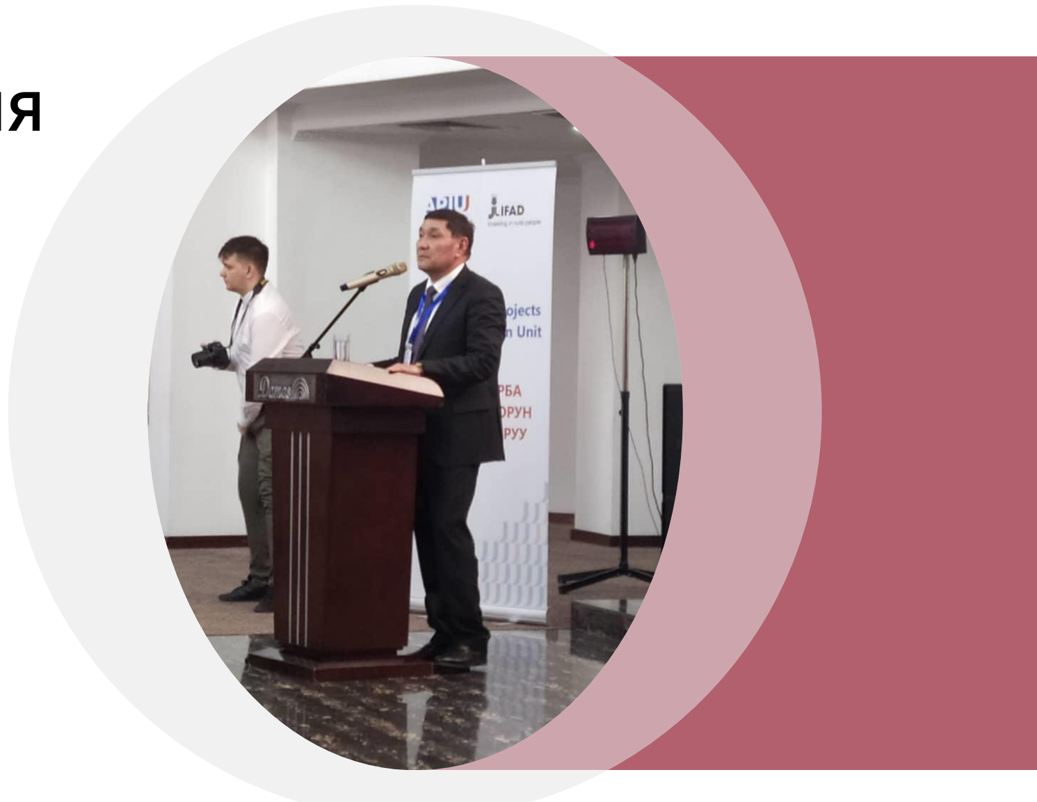
Министр сельского, водного хозяйства и развития регионов А.Джаныбеков