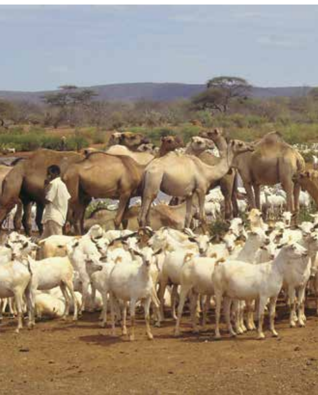
Cabras y camellos cerca de un abrevadero en Somalia. Wolfgang Bayer

Se deberían dedicar fondos, tiempo y recursos suficientes para que la evaluación mundial integrada aborde los desafíos metodológicos y preparatorios identificados durante el análisis de las deficiencias, como: i) la inclusión de pastores indígenas o locales en un proceso internacional participativo dirigido a desarrollar un diccionario que incluye una terminología comparable o en relación (ontología semántica) al pastoralismo y las tierras de pastoreo; ii) la selección participativa de los límites, el alcance y la metodología más adecuados del sistema, y iii) el establecimiento de alianzas bilaterales para acceder a datos que no estén plenamente disponibles en línea. Se debería alentar a los Gobiernos a que faciliten a la evaluación mundial integrada acceso directo a las estadísticas existentes en el plano local y nacional, así como a datos primarios, con el fin de contribuir a mejorar el desglose de los datos existentes siempre que resulte posible.