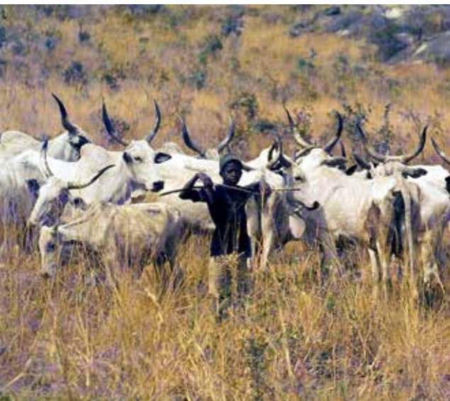
Pastor del pueblo fulani en Nigeria central. Wolfgang Bayer

Dado que en la actualidad no existe una definición, una metodología, un conjunto de indicadores,