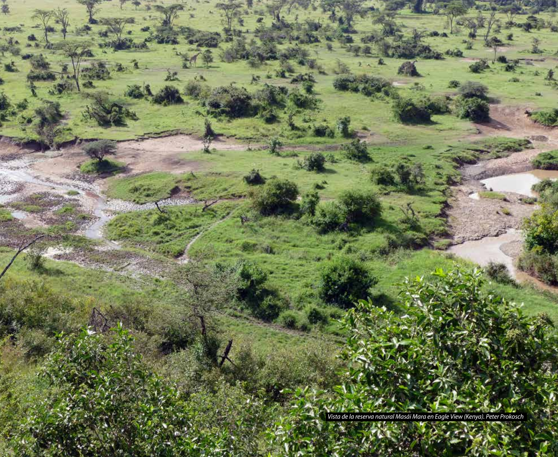
Vista de la reserva natural Masái Mara en Eagle View (Kenya). Peter Prokosch