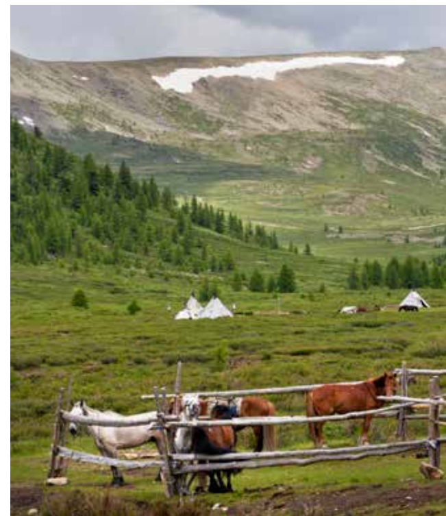
Campamento de verano de los criadores de renos del pueblo dukha, provenientes del este de la taiga (Mongolia).

estas trabajan a documentar datos e información de alta calidad sobre los pastores y los pastizales — incluidos datos sobre los conocimientos y tecnologías locales e indígenas— y a darlos a conocer.