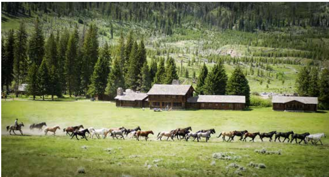
Caballos para el pastoreo corren por una pradera en Montana (Estados Unidos de América).

Todos los acuerdos, protocolos y convenciones internacionales pertinentes sobre el medio ambiente, así como otros acuerdos internacionales pertinentes, deberían abordar explícitamente las cuestiones del pastoralismo sostenible y el estado de la vegetación, según proceda con arreglo a sus objetivos y obligaciones.