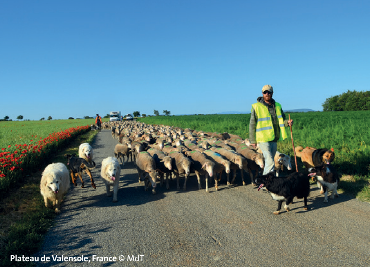
Plateau de Valensole, France

Traduction français - anglais assurée sur les 3 journées