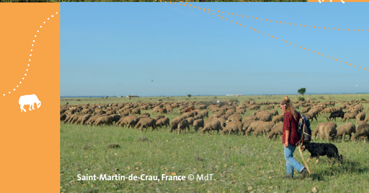
Saint-Martin-de-Crau, France