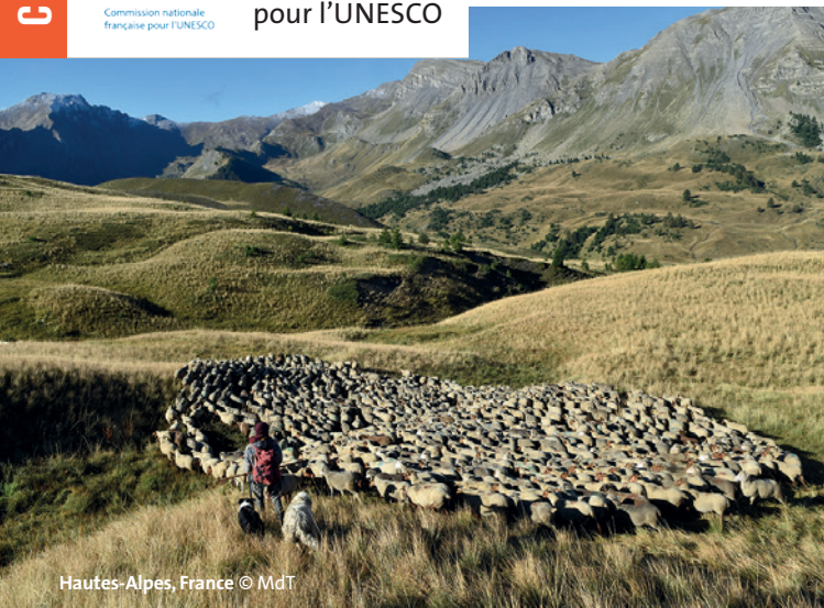
Hautes-Alpes, France

Sous le patronage de la Commission nationale française pour l'UNESCO