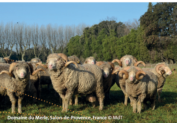
Domaine du Merle, Salon-de-Provence, France

Retour en bus à Marseille - Arrivée prévue vers 17h30